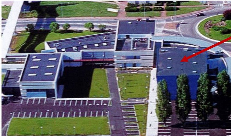
Halle du bâtiment Image

Construit en 2001 dans la même opération que la construction du bâtiment hébergeant le BUT Sciences et Génie des Matériaux de l'IUT de Chalon sur Saône, ce bâtiment de 1600 m 2 de surface comprend une halle « audio-visuel » plateau technique de 400 m 2 et de 10 m de hauteur en simple rez de chaussée ainsi que des locaux tertiaires.